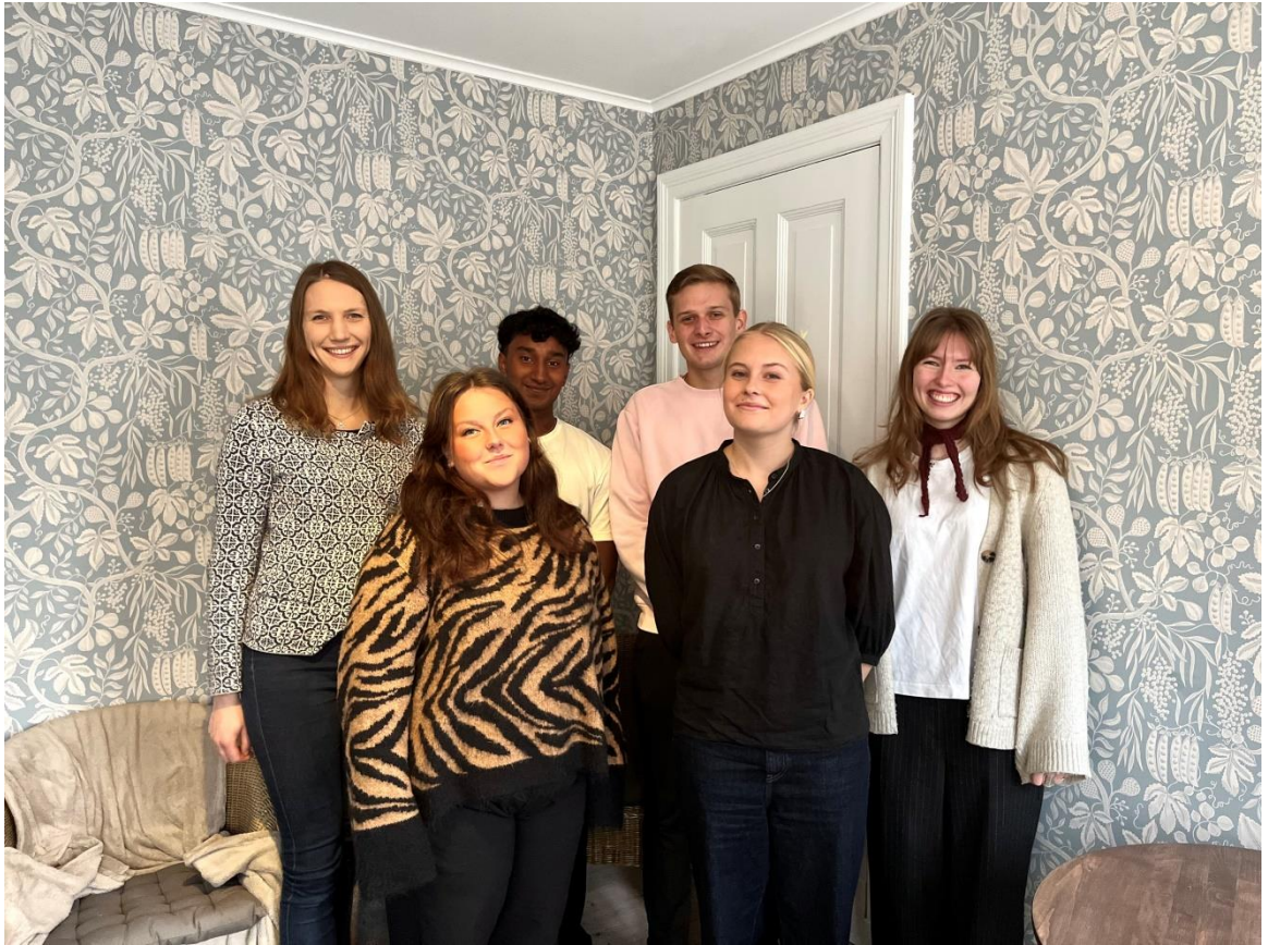
Salt Sydsveriges styrelse 2025.